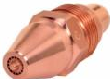
Bico Aquecedor MA-3 Acetileno (Desempeno por chama)