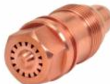
Bico Aquecedor FY-6 e FY-10 GLP (Aquecimento e desempenho)