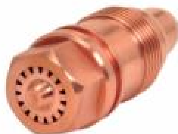
Bico Aquecedor FA-6 Acetileno (Aquecimento e desempenho chama concentrada)